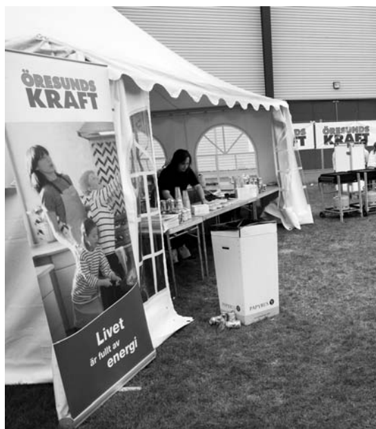
Event på Olympia i samband med match

Vi har under 2005 lyckats knyta till oss en ny nationell huvudsponsor inför 2006, Fritidsresor, som vi har för avsikt att ha ett långvarigt samarbete med. Förväntningarna på samarbetet är stora